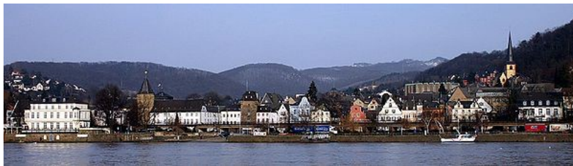
Illustration 3: von René Rondot - veröffentlicht auf Wikipedia

Am Sonntagmorgen starten wir um 9.45Uhr Abfahrt ab Haus Venusberg. Nach einer kurzen Busfahrt erreichen wir den Bootsableger der Reederei Köln-Düsseldorfer. Hier steigen wir auf ein Ausflugsschiff, auf welchem wir bei hoffentlich sonnigem