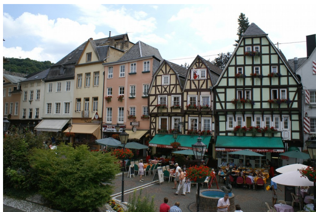
Illustration 4: von Dr. Eugen Lehle - veröffentlicht auf Wikipedia

Wetter 2,5 Stunden den größten Fluss Deutschlands Richtung Süden „hinauf“ fahren werden. Der Rhein ist einer der bekanntesten Flüsse in Europa und erstreckt sich von seiner Quelle in der Schweiz bei Graubünden bis er in die Nordsee aufgeht in den Niederlanden.